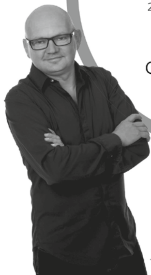
Jürgen Hubrach Inh.