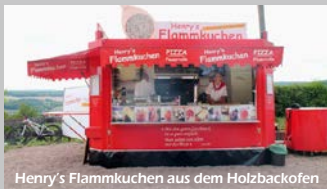
Henry's Flammkuchen aus dem Holzbackofen