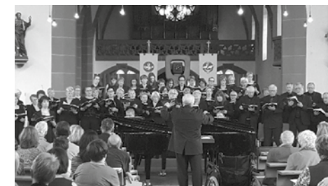
Gemischter Chor Erlenbach 1948 e.V.