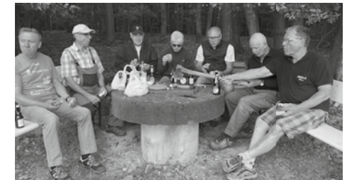
Das Foto zeigt die Mechenharder Rentnergang bei der ersten Sitzprobe.

Die Rentnergang Mechenhard war wieder aktiv. Sie haben die komplette Sanierung der „alten“ Ruhebänke von Erlenbach bis Streit übernommen. Außerdem haben sie den alten Brunnenstein, der gegenüber der Mechenharder Kirche platziert war, abgebaut und an einem neuen Standpunkt aufgebaut.