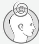
Schwindel mit Gangunsicherheit