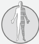
Lähmung, Taub- heitsgefühl