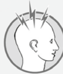
Sehr starker Kopfschmerz

Helfen Sie uns, Leben zu retten und Behinderungen zu vermeiden. Mit Ihrer Spende.