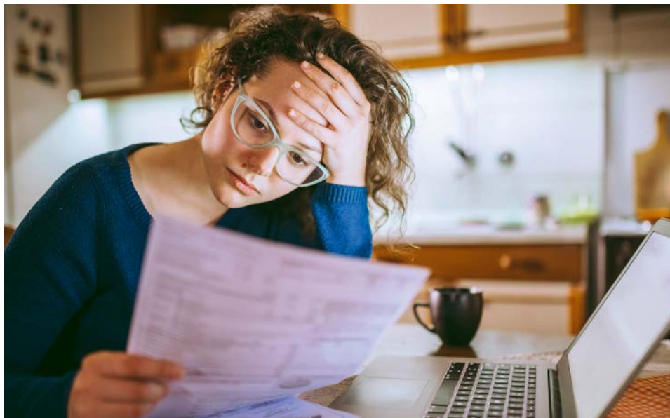
Jahr für Jahr hinterlassen insolvente Stromlieferanten frustrierte Kundinnen und Kunden. Die bleiben dann nicht nur häufig auf ihren Forderungen sitzen, sondern müssen sich auch noch um einen neuen Stromliefervertrag kümmern. Aber das Licht bleibt an. Denn zuverlässige Grundversorger wie der EZV übernehmen den Auftrag ohne Unterbrechung.

Fazit: Sich für den EZV zu entscheiden, ist eine gute Sache. Denn mit jedem Kunden bekommen die Energieexperten aus Wörth mehr Gestaltungsspielraum. Und den nutzen sie für zweierlei: für faire, seriös kalkulierte Preise und für eine prosperierende Region.