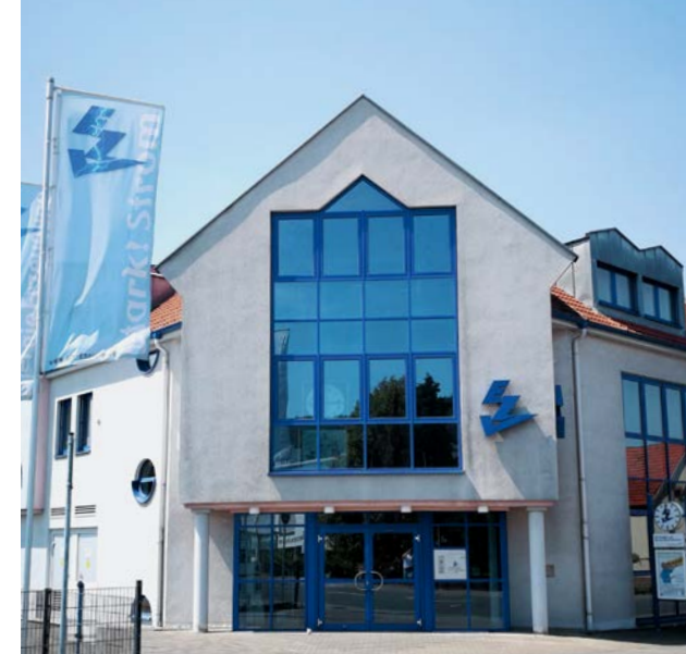
Der EZV bietet eine zuverlässige Versorgung, beste Beratung und faire Preise.

Zudem erkennen immer mehr Kunden, dass die Vergleichsportale im Internet zwar bisweilen einen Überblick verschaffen, aber mit Vorsicht zu genießen sind. Deren Bewertungen und Ranglisten bilden nämlich nicht unbedingt die Realität ab. Denn die vorderen Plätze lassen sich mit hohen Provisionen kaufen, was üblicherweise für den unbedarften Nutzer nicht zu erkennen ist. Dieses Vorgehen hat inzwischen auch das Bundeskartellamt bemängelt. In einer Presse-