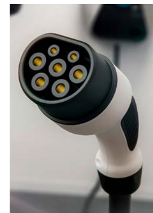
Der Typ-2-Stecker hat sich inzwischen bei vielen Herstellern durchgesetzt.

Eine vierte Alternative können sogenannte Booster sein. Diese mobilen Geräte lassen sich über verschiedene Adapter mit herkömmlichen Steckdosen oder Drehstromsteckdosen verbinden. Letzteres ermöglicht ebenfalls eine deutliche Reduzierung der Ladezeit.