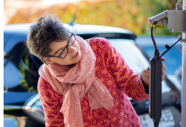
Es muss nicht zwangsläufig eine Wallbox sein: Vor allem bei Zweitwagen leistet das mit dem Fahrzeug gelieferte Ladegerät in Verbindung mit einer ausreichend abgesicherten Steckdose gute Dienste.

Doppelt so schnell läuft der Ladevorgang mit einer 22-kW-Wallbox ab. Hierbei gilt es zu beachten, dass die Ladeleistung nach 80 Prozent Füllung gedrosselt wird, um die Belastung für die Akkus zu reduzieren. Genau aus diesem Grund werden häufig die Zeiten verglichen, die es braucht, um eben jene 80 Prozent zu erreichen. Für einen Zoe hieße das: etwa eine Stunde und 40 Minuten.