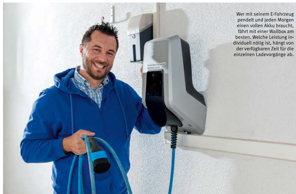
Wer mit seinem E-Fahrzeug pendelt und jeden Morgen einen vollen Akku braucht, fährt mit einer Wallbox am besten. Welche Leistung individuell nötig ist, hängt von der verfügbaren Zeit für die einzelnen Ladevorgänge ab.

Liegt die tägliche Laufleistung bei rund 100 Kilometern, erweist sich in den meisten Fällen eine Wallbox als sinnvollste Lösung. Die gibt es mit Leistungen von 11 oder 22 Kilowatt (kW). „Die kleine Version dürfte für das Gros der Anwendungen genügen. Beispiel Renault Zoe mit einem 41-Kilowattstunden-Akku: Der wäre an einer 11-kW-Box in rund dreieinhalb Stunden wieder zu 80 Prozent voll. Auch diese Wallboxen gelten als akkuschonend.“