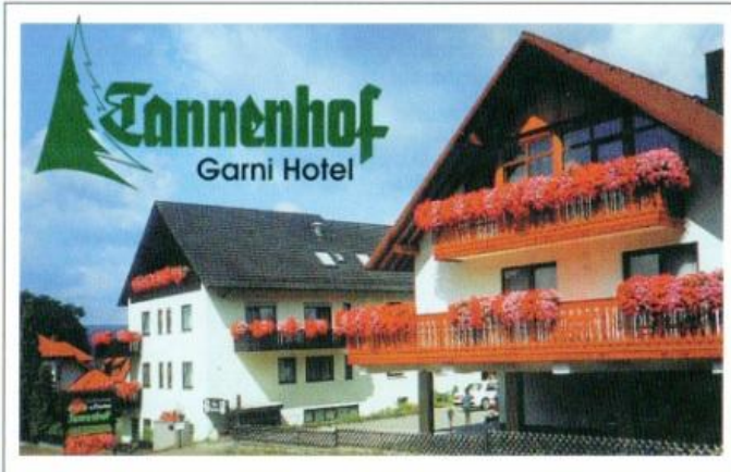
Autor Mainland Miltenberg Churfranken e.V. Quelle Mainland Miltenberg-Churfranken e.V.