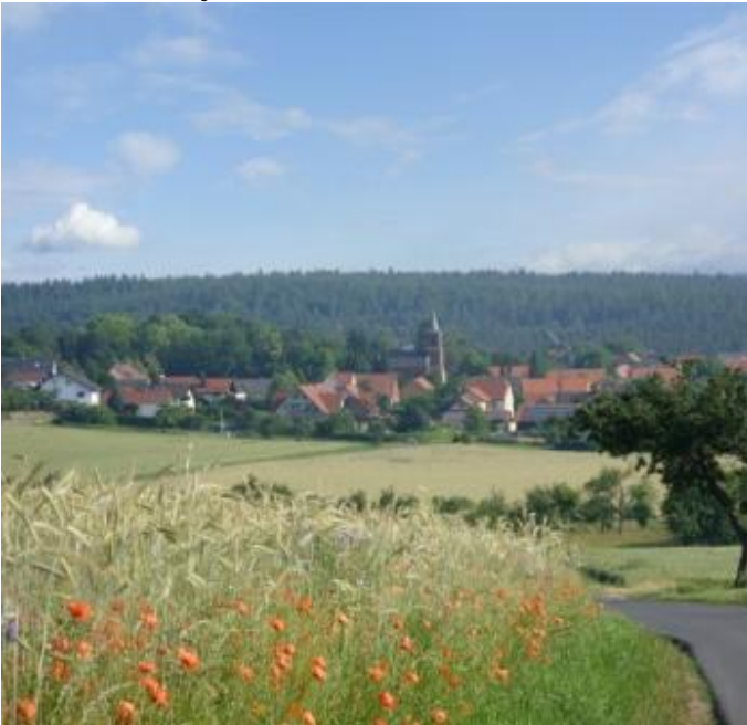
Erlenbach OT Streit Autor Mainland Miltenberg Churfranken e.V. Quelle Mainland Miltenberg-Churfranken e.V.