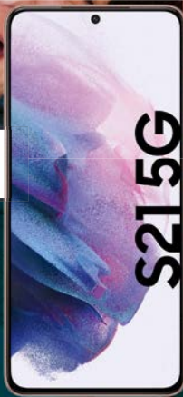
SAMSUNG Galaxy S21 5G

120 € Cashback 5 Kein Bereitstellungspreis i.H.v. 39,95€ 1