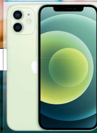
iPhone 12 mini