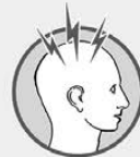
Sehr starker Kopfschmerz

Helpen Sie uns, Leben zu retten und Behinderungen zu vermeiden. Mit Ihrer Spende.