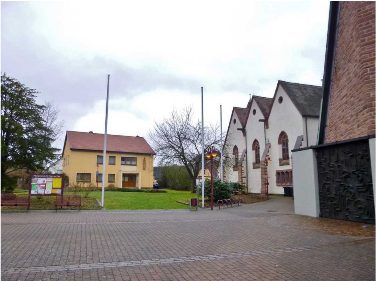
Vom Haupteingang der Kirche der Blick nach Süden zum Pfarrhaus.