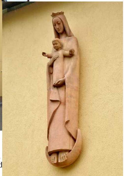
Am Pfarrhaus die Statue Maria mit Kind vom Bildhauer Franz Bernhard