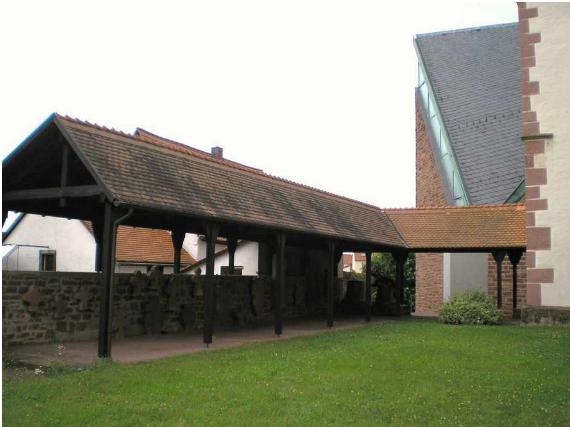
Heute ist aus dem ehemaligen Kirchhof ein Hof mit Wandelgang und Gedenktafeln geworden.