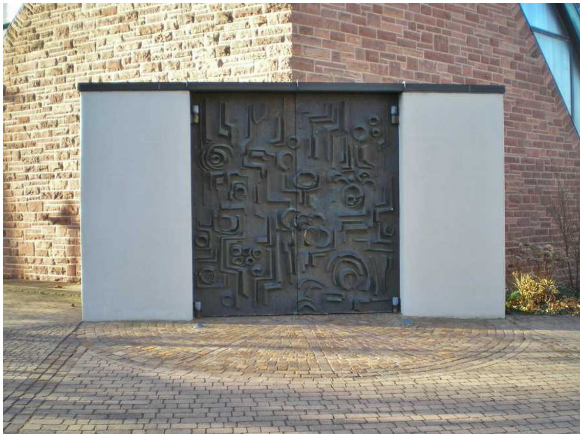
Der Haupteingang der Kirche, gestaltet von Max Walter