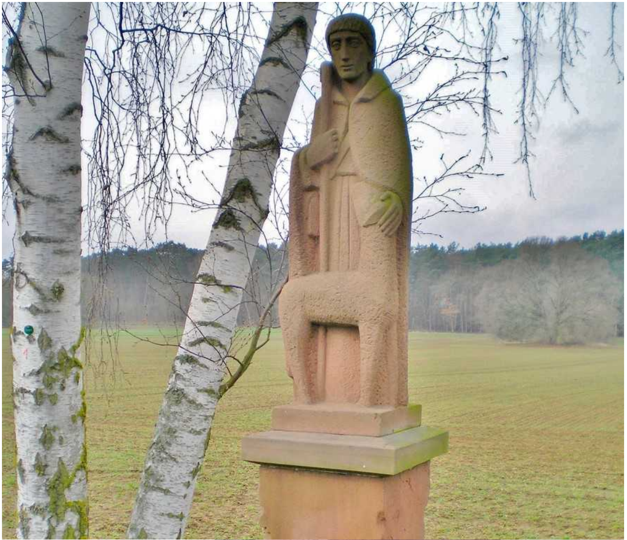
gestiftet 1973 von der Jagdgenossenschaft.