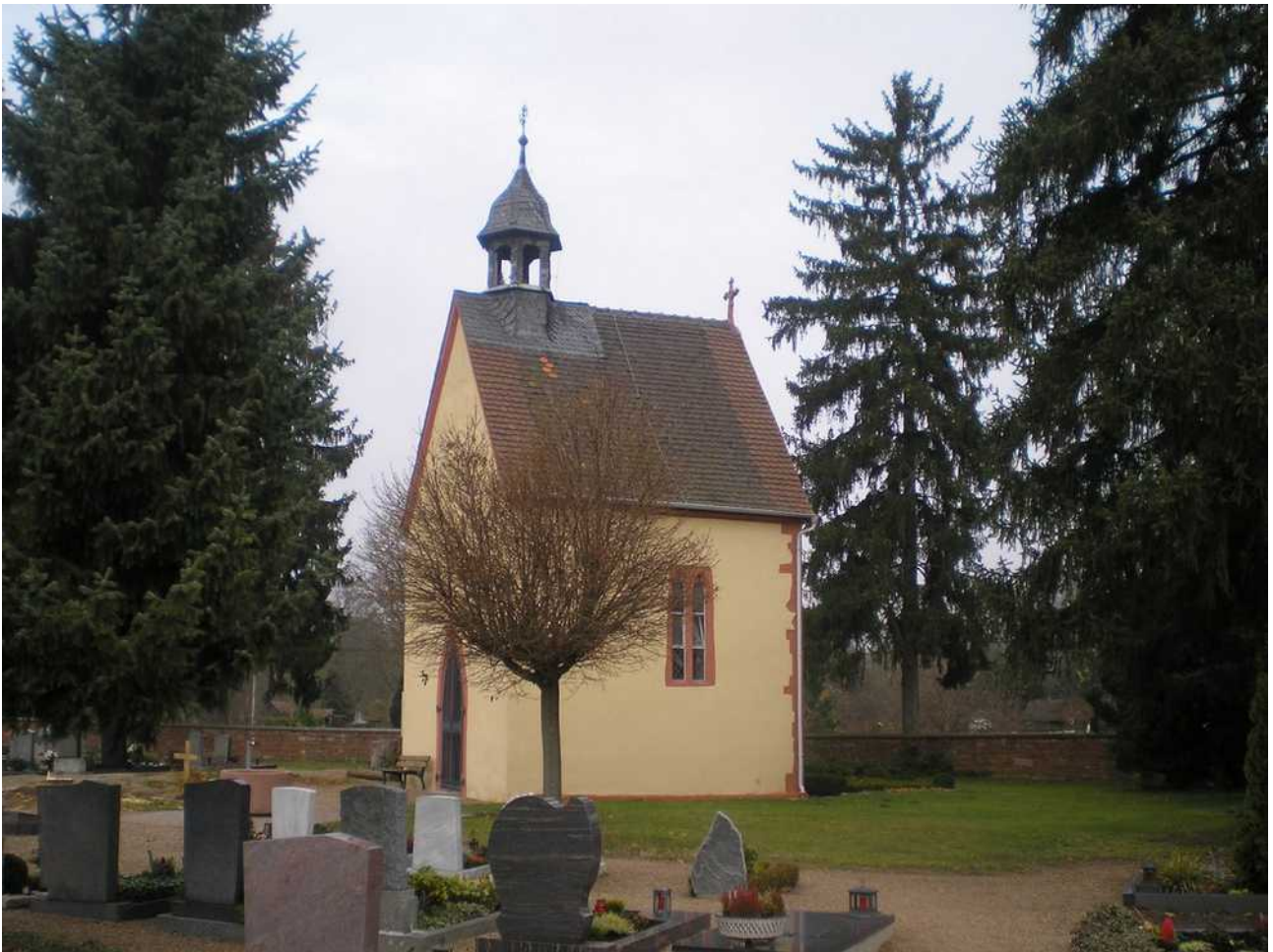
Die Kapelle St. Martin ist heute die Friedhofskapelle der Stadt Wörth am Main. Die Kirche St. Martin ist bereits in der Pfinzing-Karte von 1594 eingetragen, am Mainbogen zwischen der „Stat Werth und dem Ort Erlepach“