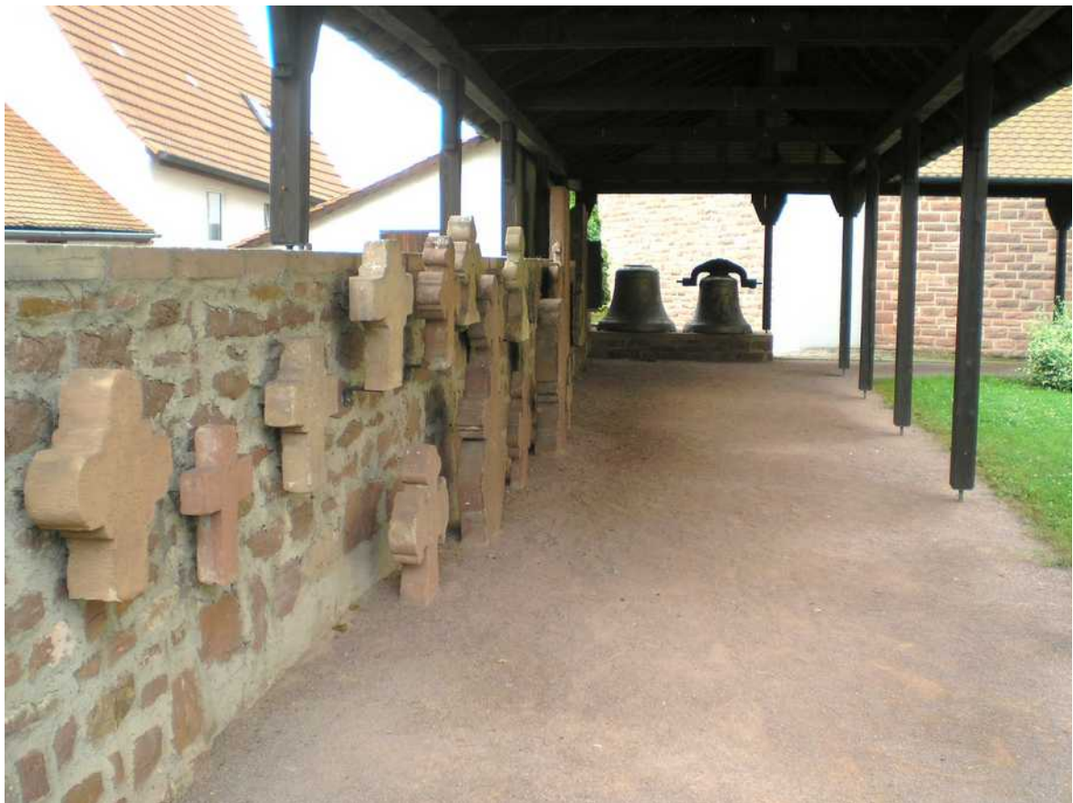
Die Gedenktafeln und deren Inschriften sind in der Broschüre "Kirchenjubiläum 1908-2008" näher beschrieben.