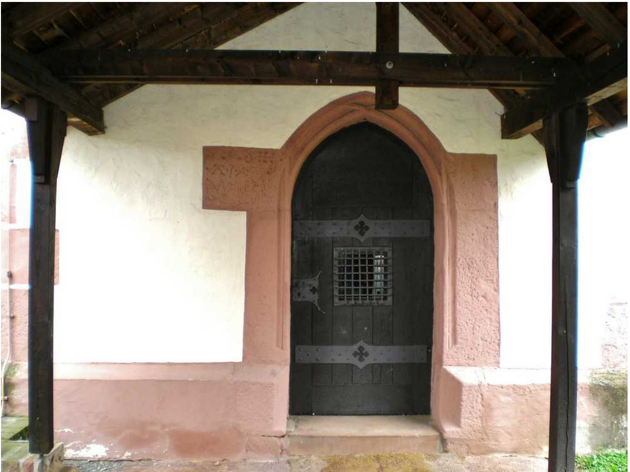
Der überdachte Außeneingang zum Turm mit einer Steininschrift aus der Umbauzeit des Turms.

Der Stein oben links an der Türe zum Turm trägt die Jahreszahl 1499, wobei die Ziffer 4 noch als "Wurstbündel" geschrieben wurde. Eine Schreibweise, die den alten römischen Zahlbuchstaben entsprach.