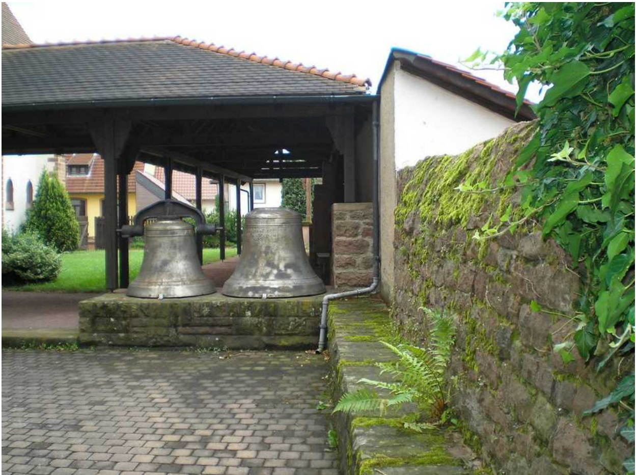
Die beiden alten Glocken im Innenhof geben einen Eindruck der Größe, der Gewichte und der Kräfte, die beim Läuten im Glockenstuhl wirken.