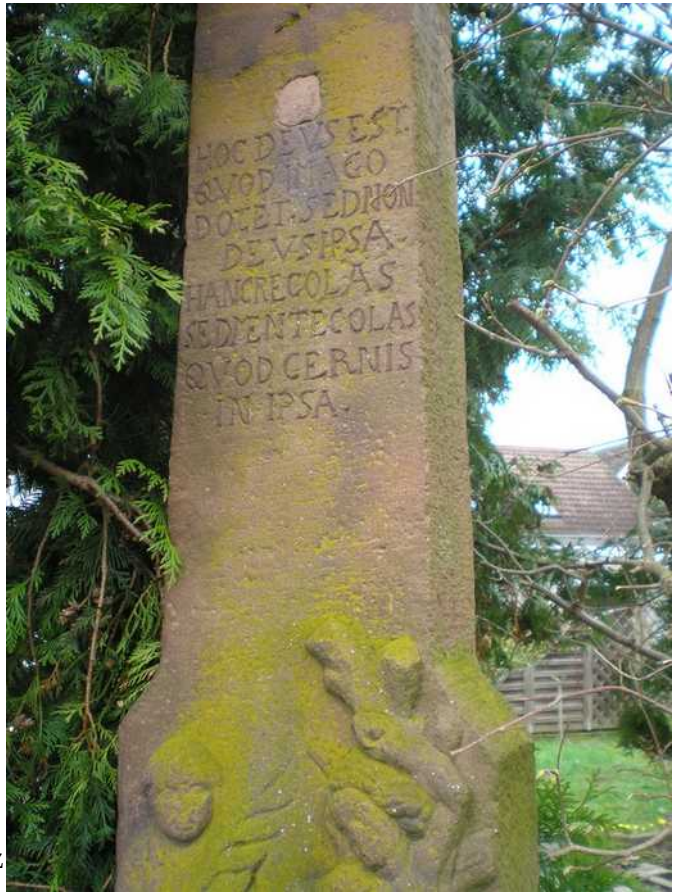
Seine Tochter und Sohn wurden von der Pest dahingerafft. Der Witwer soll achzigjährig, kurz vor seinem Tod das Kreuz gestiftet haben.

Die Inschrift auf dem Sockel unten (in Latein und Deutsch):