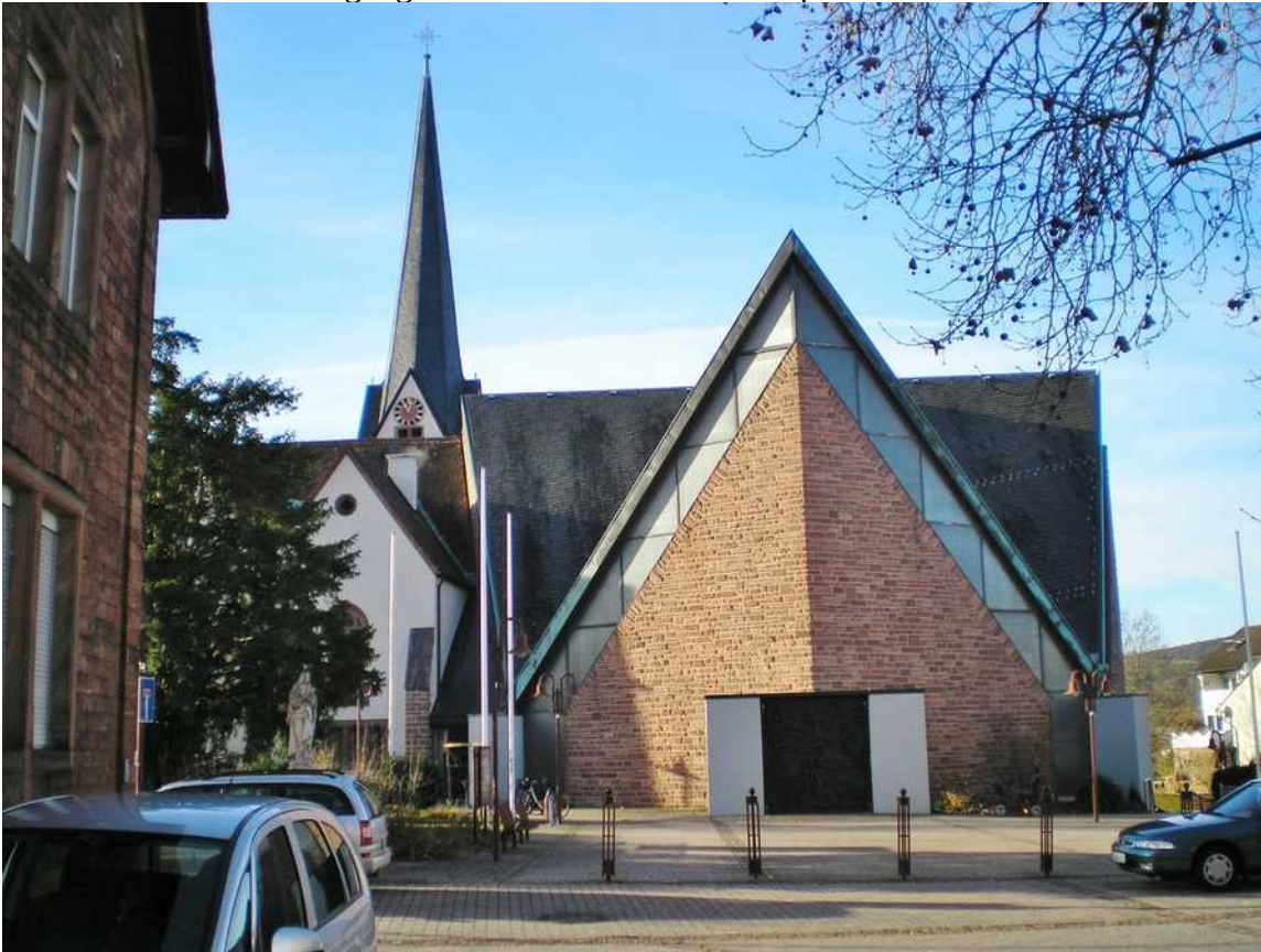
Der Platz vor der Kirche St. Peter und Paul, von der Hauptstr. her gesehen

Für den 1. kleinen Rundgang starten Sie am Kirchenvorplatz