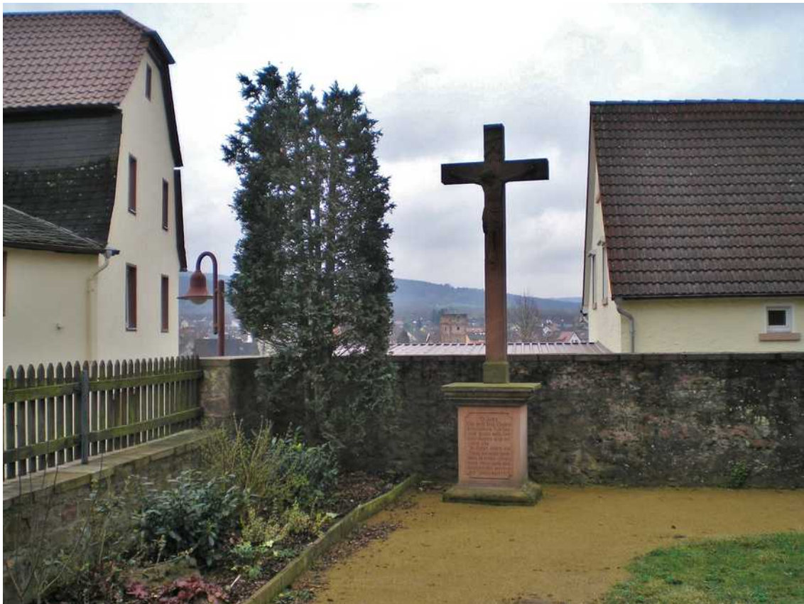
Richtung Main kommt man hinter dem alten Kirchenteil durch ein Tor in den alten Kirchhof.

Der Hof um die Kirchen war üblicherweise der Kirchhof. In dem geweihten Boden wurden auch die Toten aus Erlenbach und den umliegenden Filialen Mechenhard, Streit, Ober- und Unterschippach und NeuhoF beerdigt. Zu Kriegs- und Pestzeiten reichte der Platz nicht, was oft zu caotischen und unhygienischen Zuständen führte. Deshalb mussten später Friedhöfe weit außerhalb der Orte angelegt werden.