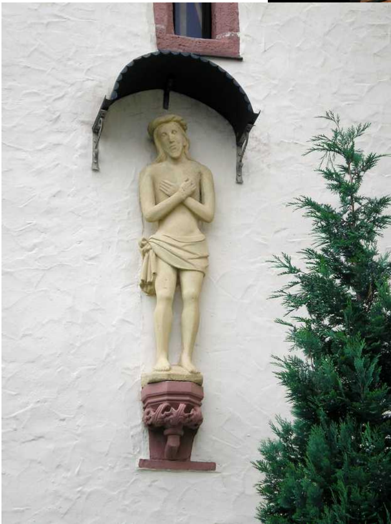
Die Steinfigur "Christus der Schmerzensmann" am Turm wird einer Zeit um 1500 zugerechnet