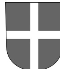
Erlenbach am Zürichsee