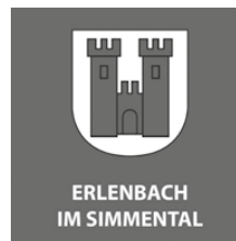
Erlenbach im Simmental