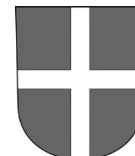
Erlenbach am Zürichsee