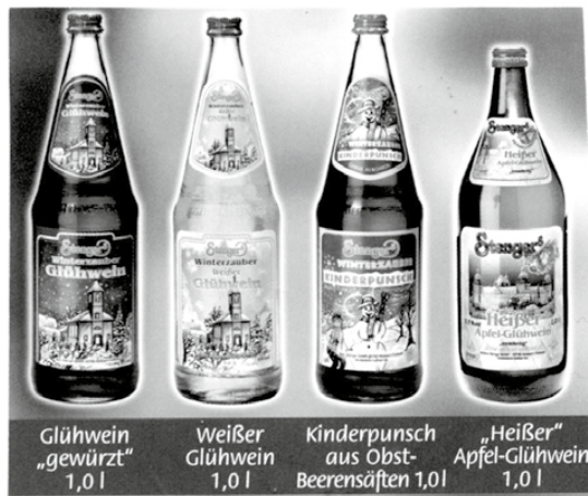
Glühwein „gewürzt“ 1,0 l Weißer Glühwein 1,0 l Kinderpunsch aus Obst-Beerensäften 1,0 l „Heißer“ Apfel-Glühwein 1,0 l

Gerne verleihen wir Ihnen zu Ihrer Veranstaltung auch unseren Warmhaltebehälter mit Zapfhahn oder unsere Glühweinschankanlagen.