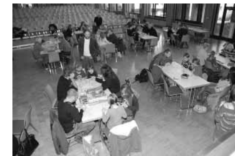
Gut besucht war der Spielenachmittag am 4. November letzten Jahres