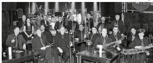
Jazz Orchestra Erlenbach

Am Sonntag, 26. April um 18 Uhr (Einlass 17 Uhr) konzertiert das Jazz Orchestra Erlenbach unter dem Motto „Barbarossa Beats“ im Musikclub Beavers. Für das diesjährige Konzertspektakel haben die 20 Damen und Herren des JOE eine breite Auswahl von Songs und Instrumentalstücken verschiedener Stilarten mit Originalen unter anderem von Oasis, Cream, den Beatles, Coldplay, Pharell Williams, Earth, Wind & Fire, Maynard Ferguson und Bill Withers mit im Gepäck und natürlich darf eine gehörige Portion Swing nicht fehlen.