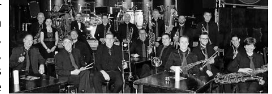
Jazz Orchestra Erlenbach

Am Sonntag, 26. April um 18 Uhr (Einlass 17 Uhr) konzertiert das Jazz Orchestra Erlenbach unter dem Motto „Barbarossa Beats“ im Musikclub Beavers. Für das diesjährige Konzertspektakel haben die 20 Damen und Herren des JOE eine breite Auswahl von Songs und Instrumentalstücken verschiedener Stilarten mit Originalen unter anderem von Oasis, Cream, den Beatles, Coldplay, Pharell Williams, Earth, Wind & Fire, Maynard Ferguson und Bill Withers mit im Gepäck und natürlich darf eine gehörige Portion Swing nicht fehlen.