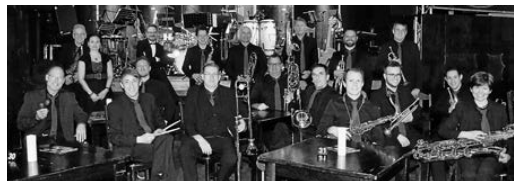
Jazz Orchestra Erlenbach; Foto: Stephan Schlett

Das Jazz Orchestra Erlenbach konzertiert unter dem Motto „Barbarossa Beats“ im Musikclub Beavers. Für das diesjährige Konzertspektakel haben die 20 Damen und Herren des JOE eine breite Auswahl von Songs und Instrumentalstücken verschiedener Stilarten mit Originalen unter anderem von Oasis, Cream, den Beatles, Coldplay, Pharell Williams, Earth, Wind & Fire, Maynard Ferguson und Bill Withers mit im Gepäck und natürlich darf eine gehörige Portion Swing nicht fehlen.