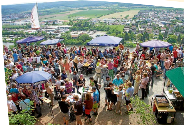
16. Erlenbacher Wengertstreppenfest