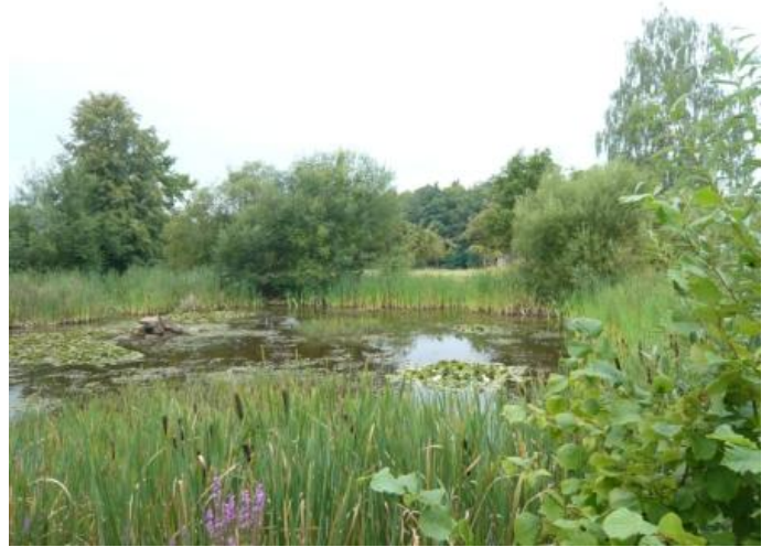
Biotop Sohl im Stadtteil Mechenhard