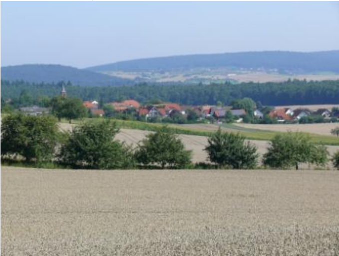
Erlenbach OT Streit