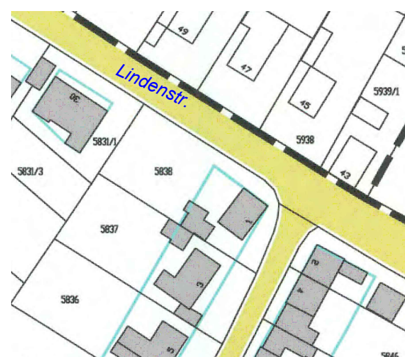
Auszug aus dem Bebauungsplan "Siedlung" Rechtskräftig seit 15.2.2001 Auszug, ohne Maßstab