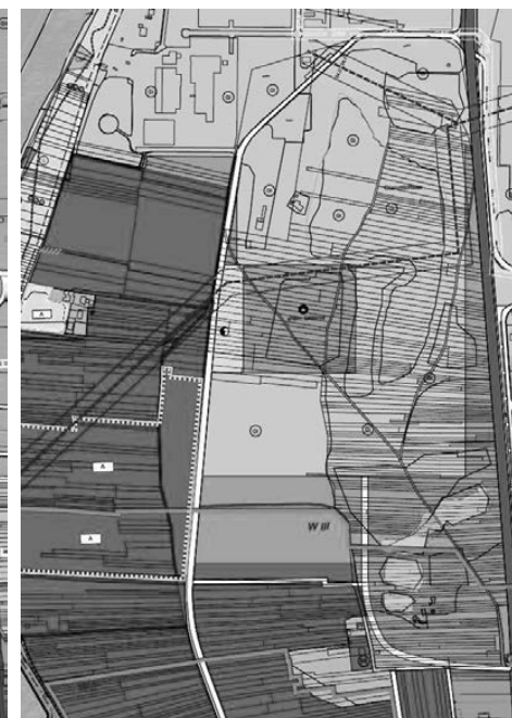
Vorentwurf zur Änderung des Flächennutzungsplans