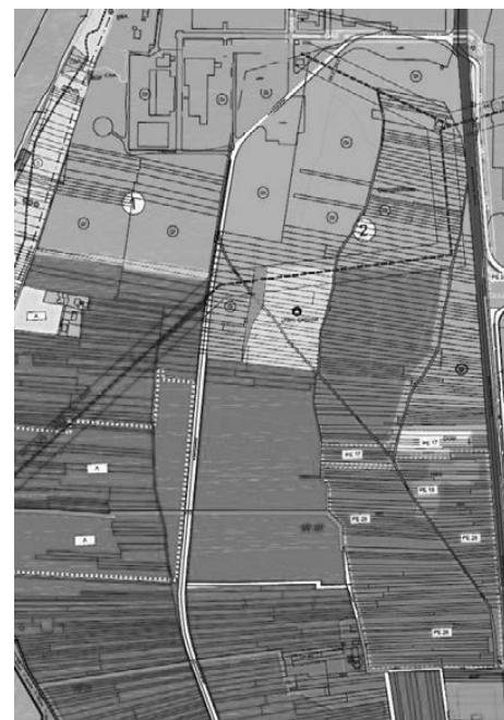
Aktueller Stand des Flächennutzungsplans der Stadt Erlenbach a. Main (Ausschnitt)

Der Stadtrat Erlenbach a. Main hat in seiner Sitzung am 30.10.2025 die Durchführung der frühzeitigen Beteiligung der Öffentlichkeit sowie die Frühzeitige Beteiligung der Behörden und sonstigen Träger öffentlicher Belange zur Änderung des Flächennutzungsplanes der Stadt Erlenbach a. Main beschlossen. Die Planung umfasst den Bereich der ICO-Süderweiterung.